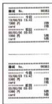
プリントイメージ